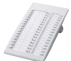
■ KX-T7740 Consola DSS