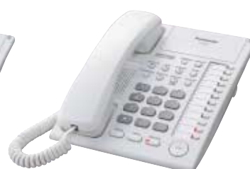
■ KX-T7750 Unidad con Monitor